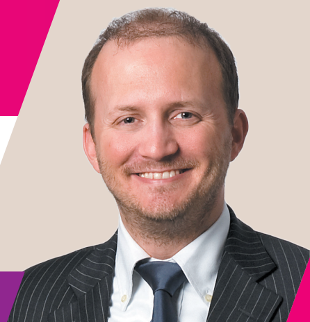
WILLIAM HURST DIRECTEUR GÉNÉRAL EDC PARIS BUSINESS SCHOOL